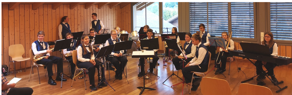
Jugendmusik A-Corps im September 2020

Am 14. August 2020 durften die Jugendlichen in dieser Zusammensetzung ihre erste Probe bestreiten. Insgesamt kam es zu fünf Zusammenkünften, jedoch aufgrund der Corona-Pandemie leider zu keinem Auftritt. Wir hoffen sehr, dass dieser im 2021 folgen wird.